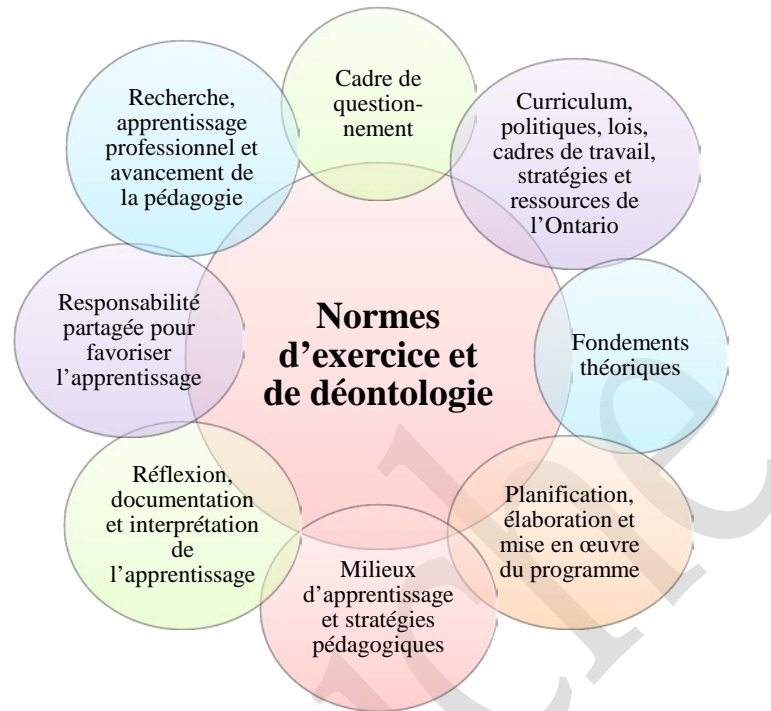
Schéma n° 2 : Cadre conceptuel pour le cours Technologie du design – Architecture