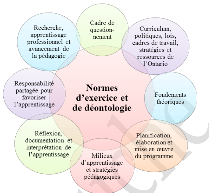
Schéma n° 2 : Cadre conceptuel pour le cours Technologie de la fabrication – Soudage et assemblage