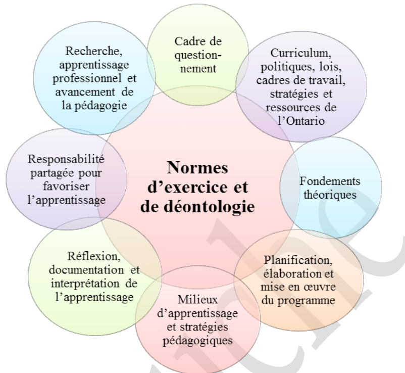
Schéma n° 2 : Cadre conceptuel pour le cours Technologie de la fabrication – Tôlerie