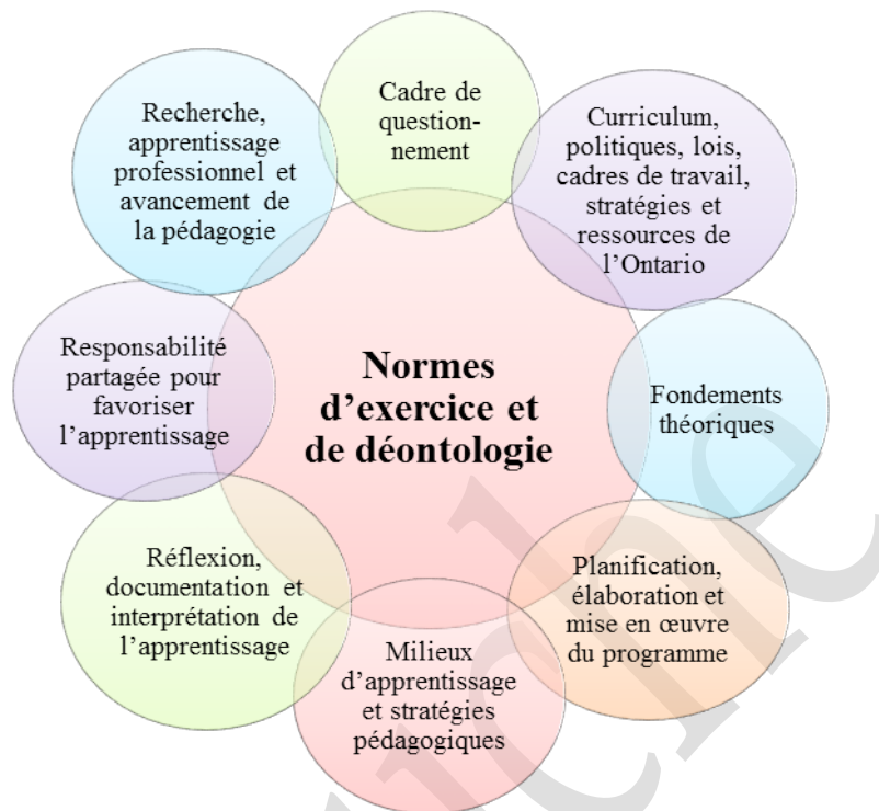
Schéma n° 2 : Cadre conceptuel pour le cours Technologie de la fabrication – Fabrication assistée par ordinateur