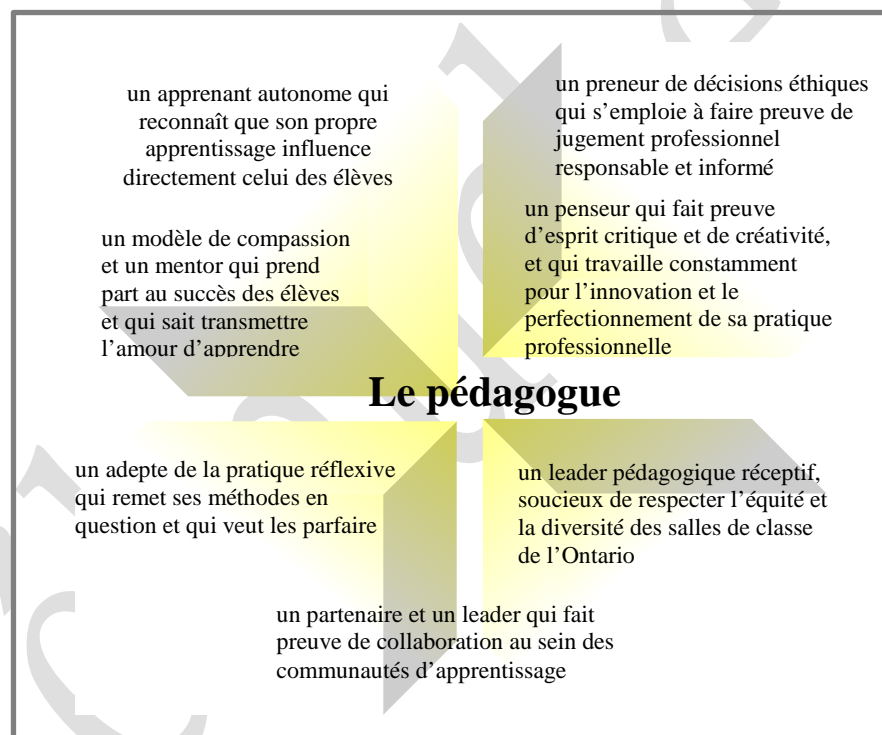
Schéma n° 2 : Image du pédagogue 1

Cette image (schéma n° 2) place le pédagogue professionnel dans un rôle de spécialiste et adepte novateur, soit un enseignant critique qui fait la promotion de la justice sociale et écologique et s'efforce d'être :