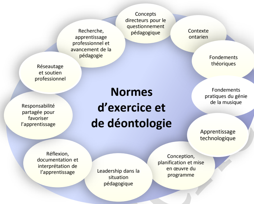
Schéma n° 4 : Cadre de questionnement pédagogique pour le cours Spécialiste en études supérieures en musique