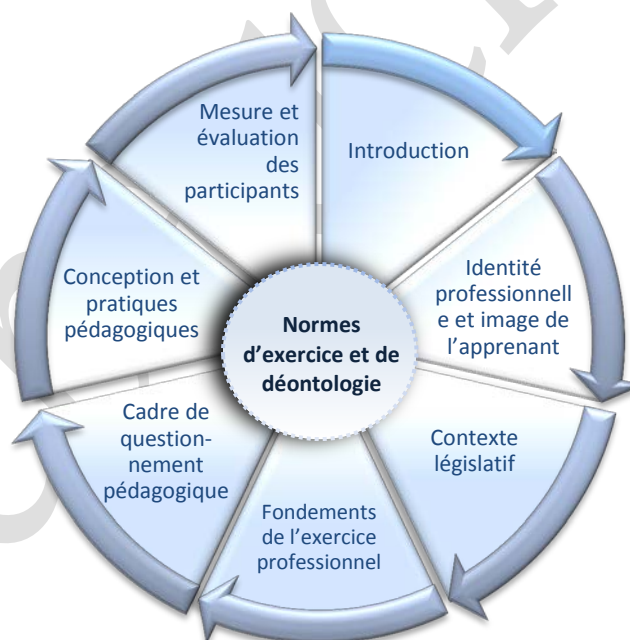
Schéma n° 1 : Cadre conceptuel

La ligne directrice du présent cours est fondée sur le cadre conceptuel suivant :