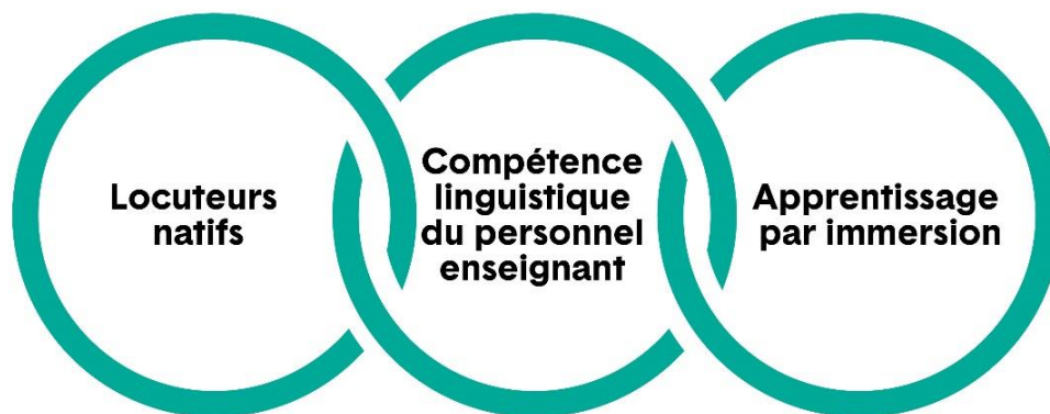
Figure 1 : Contexte important pour l'élaboration et la prestation du cours

La stabilisation de la perte linguistique pour rétablir les langues des Haudenosaunes, que ceux-ci croient avoir reçues du Créateur, est essentielle au maintien de leurs civilisations. Les valeurs et les connaissances culturelles des Haudenosaunes sont inhérentes aux langues, et l'haudenosaune y est profondément ancré, tout comme il l'est dans les territoires, les cérémonies, les pratiques culturelles et le mode de vie des Haudenosaunes, lesquels ont transcendé le colonialisme, y compris l'époque des pensionnats. Dans cette optique, les éléments suivants sont ajoutés comme points supplémentaires à considérer pour le développement et la prestation du cours menant à la qualification additionnelle Enseignement du tuscarora, au cycle supérieur :