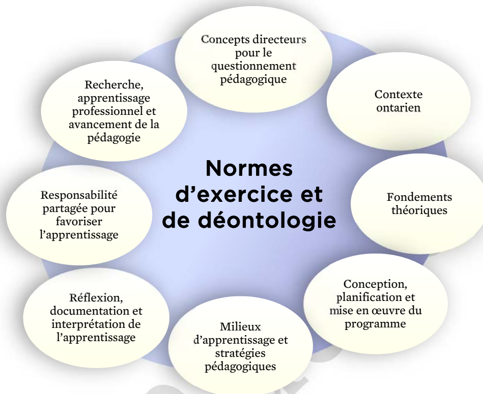
Schéma no 4 : Cadre de questionnement pédagogique pour le cours Sciences économiques au cycle supérieur