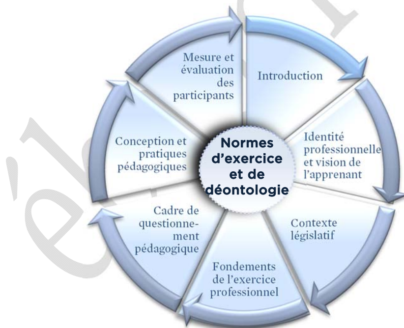
Schéma no 1 : Cadre conceptuel

La ligne directrice du présent cours est fondée sur le cadre conceptuel suivant,