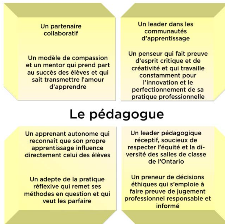
Schéma n° 2 : Vision du pédagogue 1

La vision de l'élève dans la présente qualification additionnelle (schéma n° 3) est celle d'un apprenant indépendant, autonome, démocratique, averti, créatif, collaborateur, éthique, réfléchi, conciliant, inclusif, courageux et auto-efficace ; un penseur critique qui sait résoudre les problèmes et dont la voix et le sens de l'efficacité sont essentiels à la mise au point des méthodes d'enseignement et d'apprentissage.